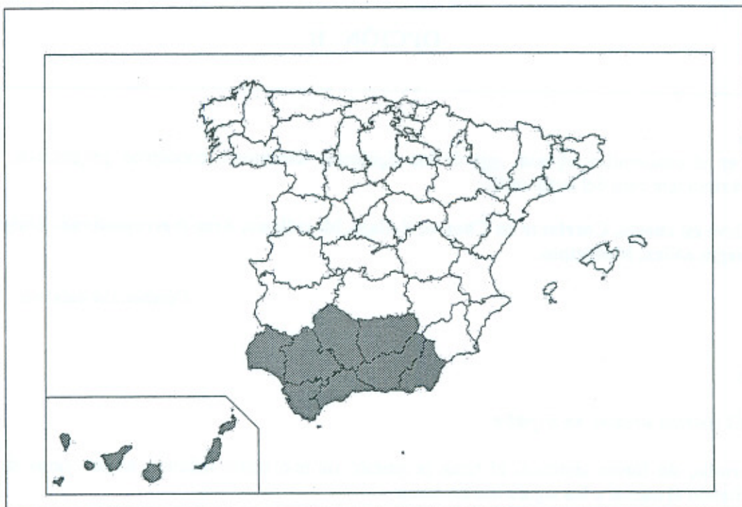
Provincias con tasa de paro superior al 16% (2007)